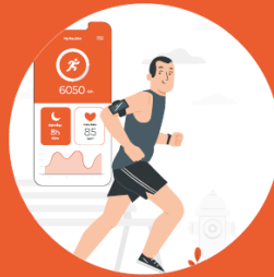
SAĞLIK & GÜVENLİK