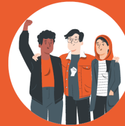
EŞİTLİK & ÇEŞİTLİLİK