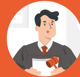
HUKUK & MEVZUAT