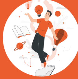
EĞİTİM & GELİŞİM