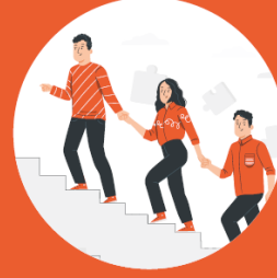
LİDERLİK & YÖNETİCİLİK